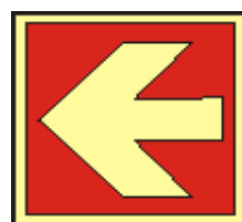
21x21 15x15 směrovka k zařízení PO