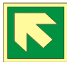
21x21 15x15 směrovka k první pomoci