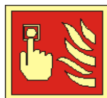
21x21 15x15 požární hlásič