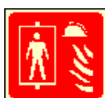
20x20 10,5x10,5 požární výtah