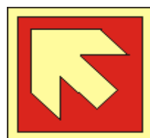
21x21 15x15 směrovka k zařízení PO