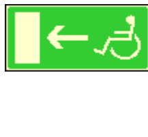
30x15 bezbariérový únik. východ