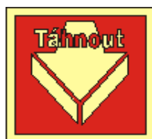
21x21 otevírání dveří