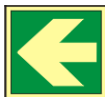
21x21 15x15 směrovka k první pomoci