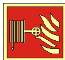
21x21 15x15 hydrant