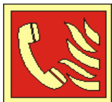
21x21 15x15 ohlašovna požáru