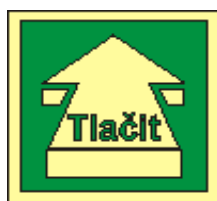
rozměr v cm 21x21 15x15 otevírání dveří