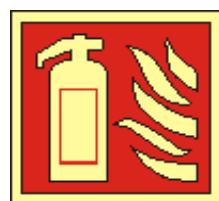
rozměr v cm 21x21 15x15 hasicí přístroj