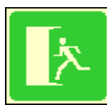
20x20 únikový východ